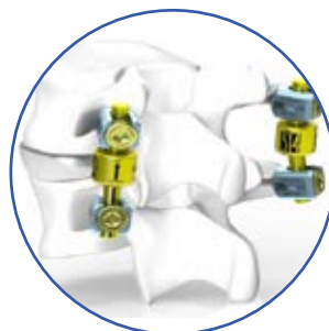
Para un segmento dinámico