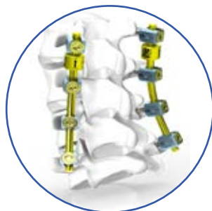
Para un segmento dinámico y uno o dos fijos

Todas las partes rígidas están hechas de Ti6Al4V (ISO 5832-3, ASTM F136)